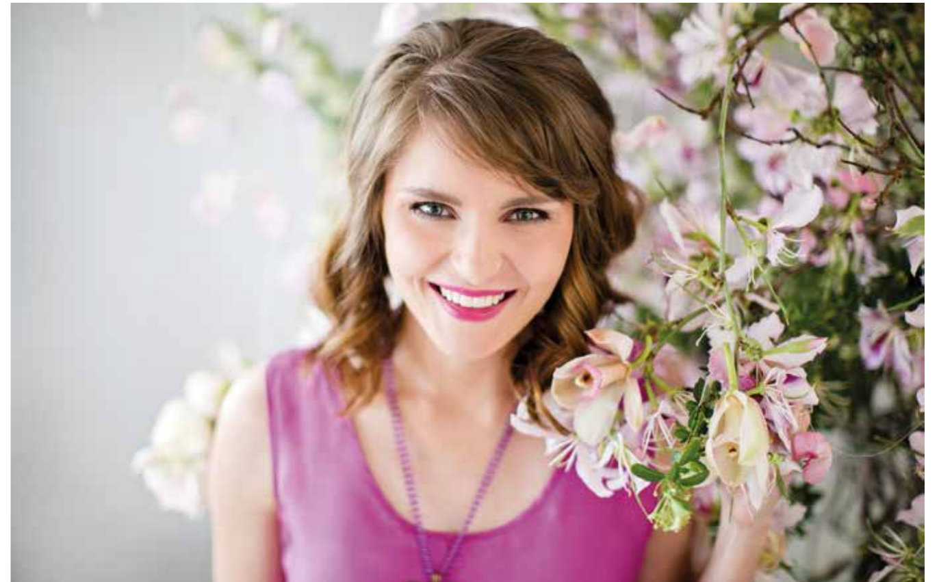
LINKS Rok en baadjie van Alana van Heerden (pryse op aanvraag). BO Top (R720) van Kat van Duinen. ONDER Hemp (R1 900) van Ted Baker by Stuttafords.

Want ons is 'n aangename geur van Christus tot eer van God...'